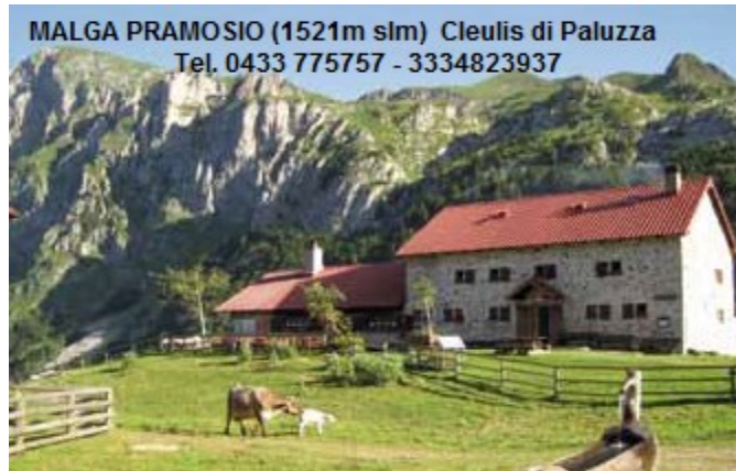
MALGA PRAMOSIO (1521m slm) Cleulis di Paluzza Tel. 0433 775757 - 3334823937